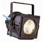
2x ADB F101 Fresnel 1kW