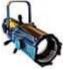
1x ADB WARP22-50 profiel spot 800w 22-50°